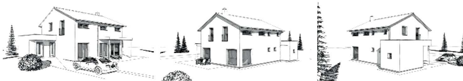
Abbildungen mit Sonderausstattung